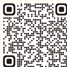
加入網上報名平台教學